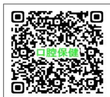
口腔保健支援センターHP

メールを送る際、件名に「イー歯トープ8020出前健口講座」をつけて送信してください