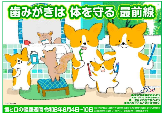
「令和8年度 歯と口の健康週間」ポスター ※ 今年のポスターには初めて、フロスと洗口剤が描かれています。

毎年6月4～10日は「歯と口の健康週間」は、歯と口についての意識を少しでも変えてもらい、自分の歯と一生をともに歩めるよう予防習慣を身につけてもらうための期間です。歯とお口は、体の健康の入り口です。何歳になっても健康な口腔状態を維持するためにも、自分で行うセルフケアと歯科医院で行ってもらうプロフェッショナルケアは重要です！この機会にご自分のお口と歯について考えてみませんか？今日でることから始めてみましょう♪